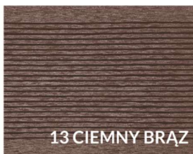
13 CIEMNY BRĄZ