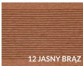
12 JASNY BRĄZ